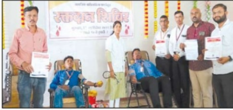
आडसूळ तंत्रनिकेतनमध्ये रक्तदान करताना विद्यार्थी आणि शिक्षक.

नगर - साकेबर ग्रामीण विकास सेवा संस्थेच्या सी. सुंदरबाई माणिक अडसूळ तंत्रनिकेतन घासच्या वतीने सामाजिक बांधिलकी जपत अहमदनगर येथील अहविनायक रक्तपेढी, नगर यांच्या संयुक्त विद्यमाने आडसूळ तंत्रनिकेतन येथे २९ डिसेंबर रोजी रक्तदान शिबीर आयोजित करण्यात आले होते.